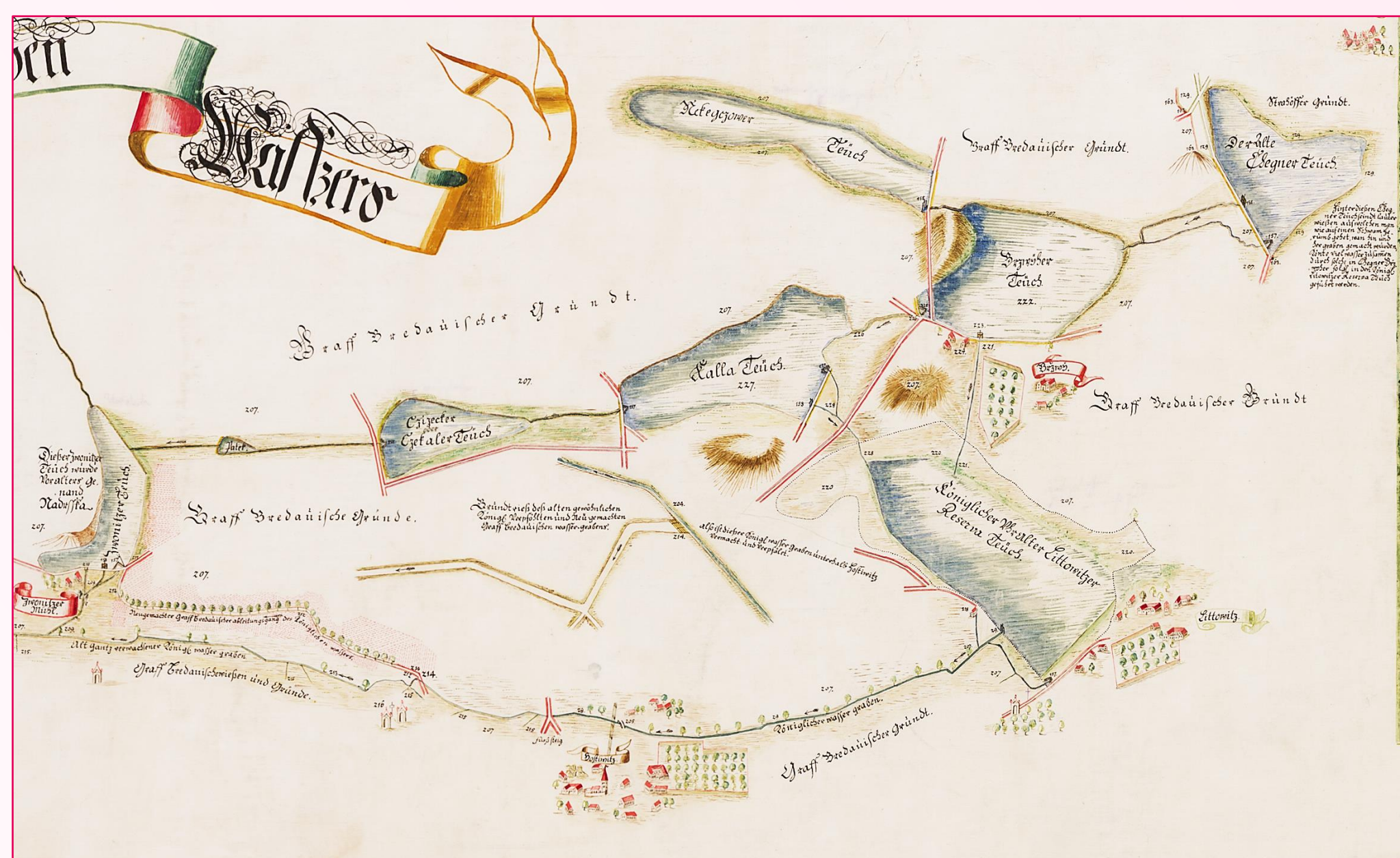
Hostivické rybníky – výřez z mapy F. L. A. Kloseho (1723). Orientováno k jihu.