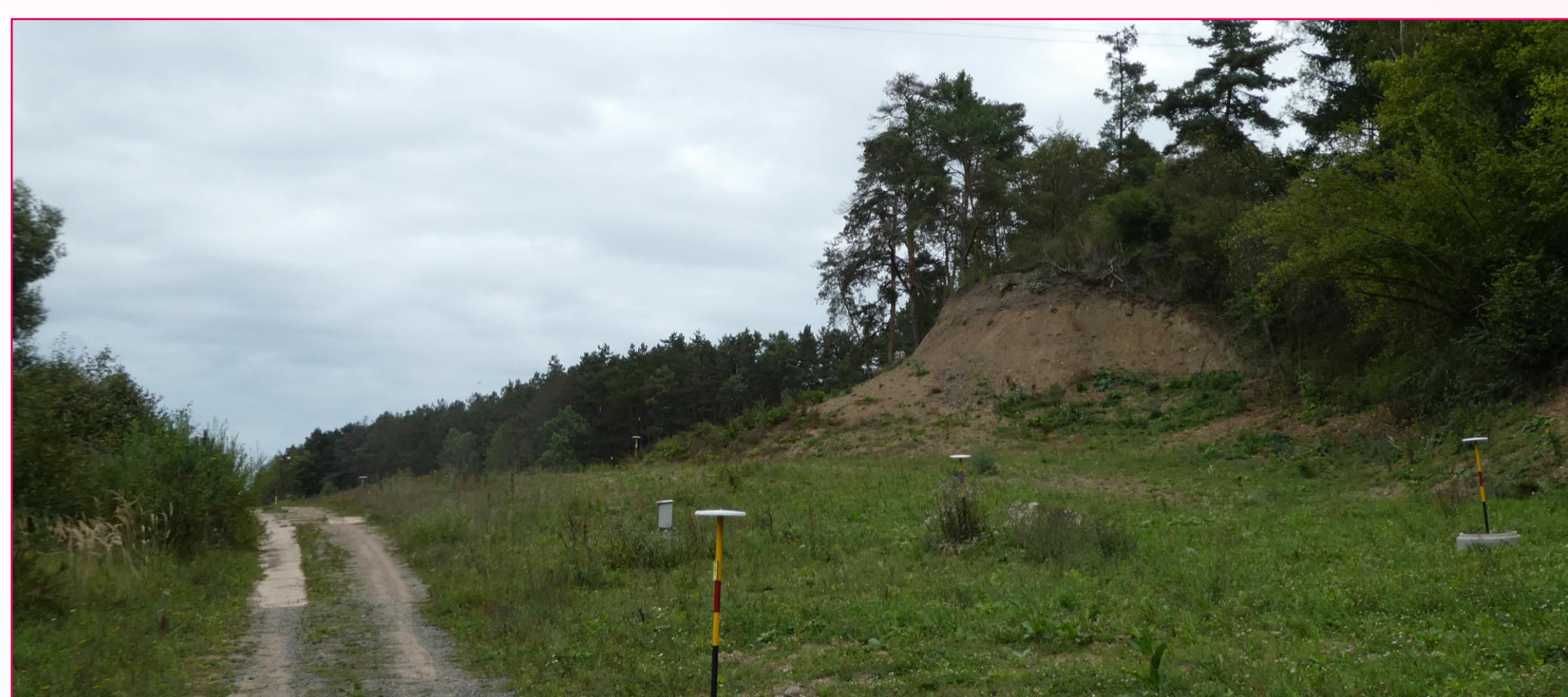
Mladotický rybník – torzo hráze protržené v letech 1550 a 1872. Foto: MV, 2021.